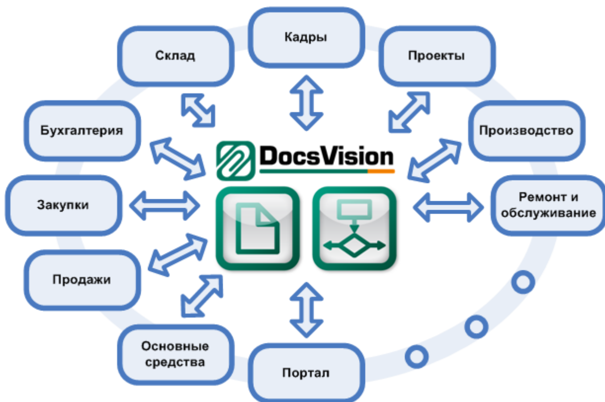
Рис.1. Место DocsVision в корпоративной информационной системе

Даже в рамках отдельных функциональных задач, таких как закупки, производство и другие, возникает потребность обработки документов и выполнения связанных операций, образующих бизнес-процесс. Кроме того, многие документы и бизнес-процессы являются сквозными, затрагивающими различные функциональные задачи: например, выполнение заявки клиента в позаказном производстве, включающее функции продажи, закупки, производства, работу склада и бухгалтерии.